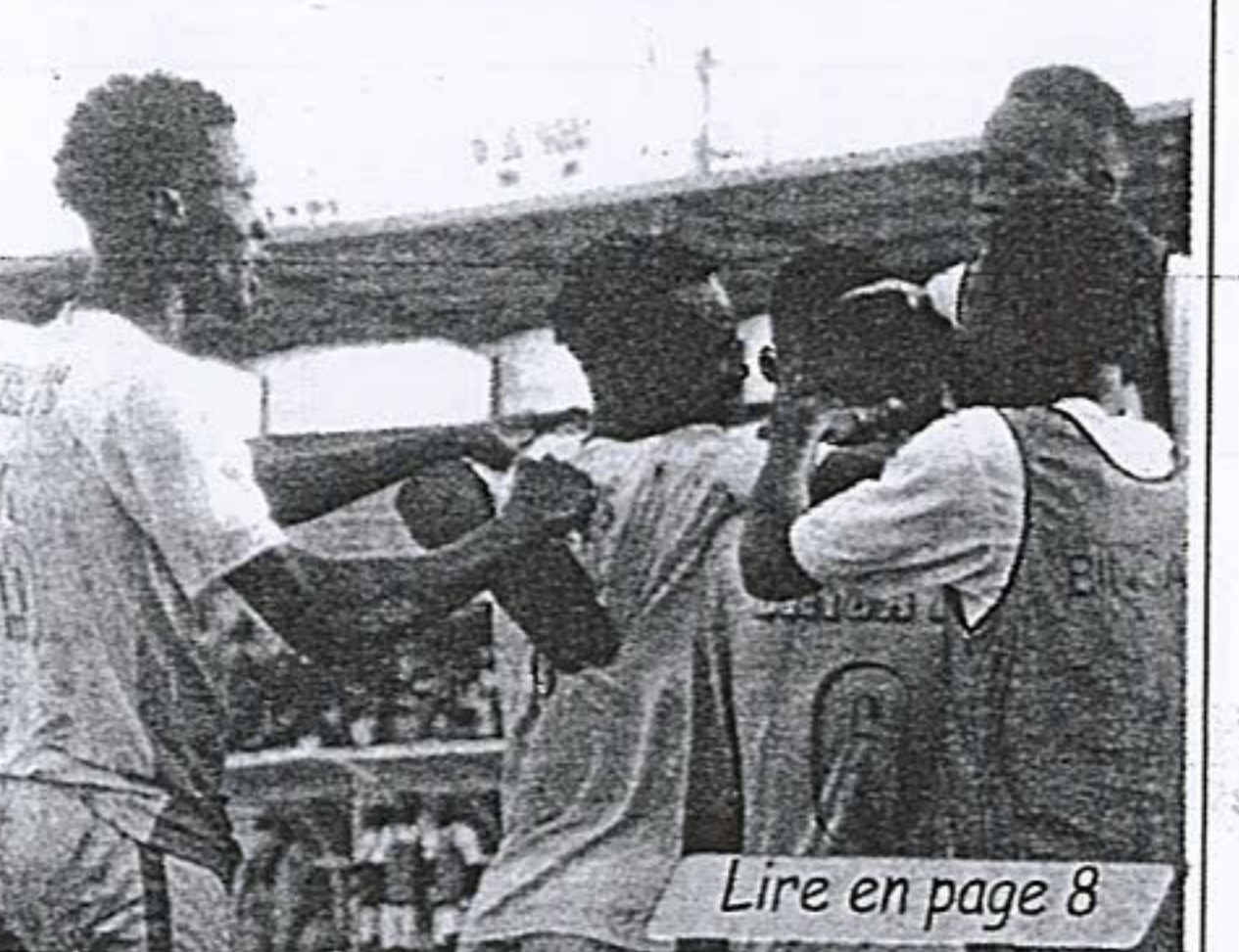
Lire en page 8

Coupe de la Confédération LA BELLE DÉMONSTRATION DE BINGA FC