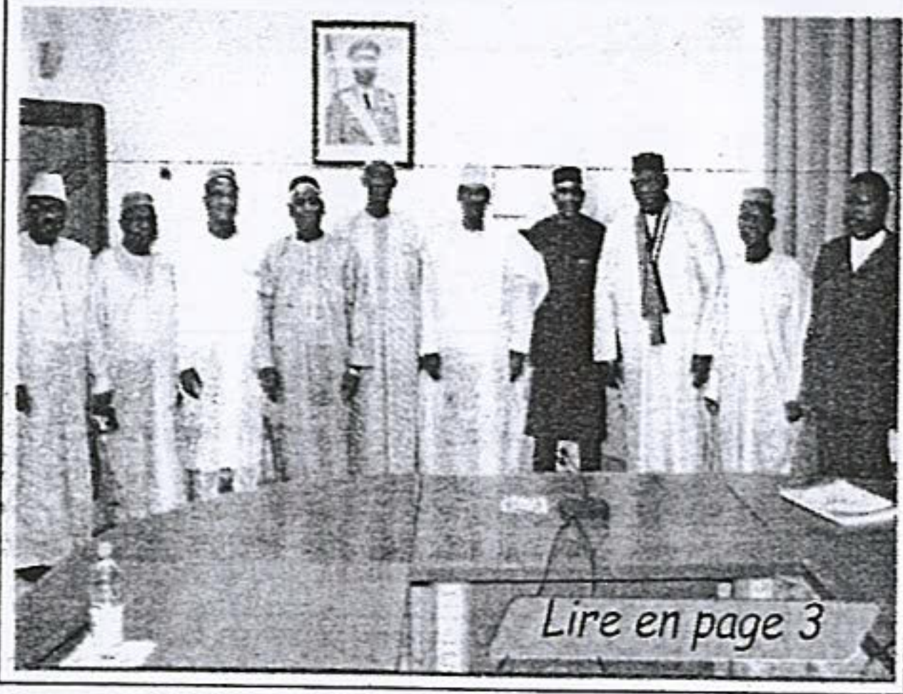
Lire en page 3

Assises nationales de la refondation LE MONDE UNIVERSITAIRE PRÊT À CONTRIBUER AUX DÉBATS